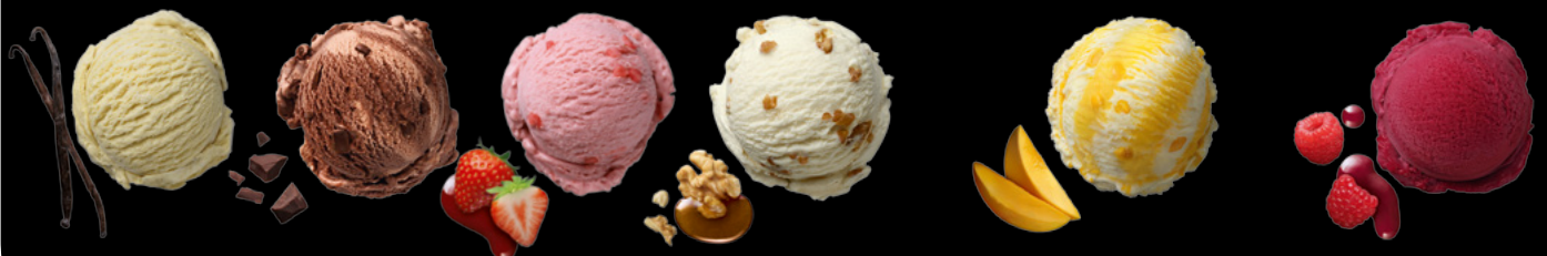
MÖVENPICK Crème Vanilla Art.-Nr. 31016344